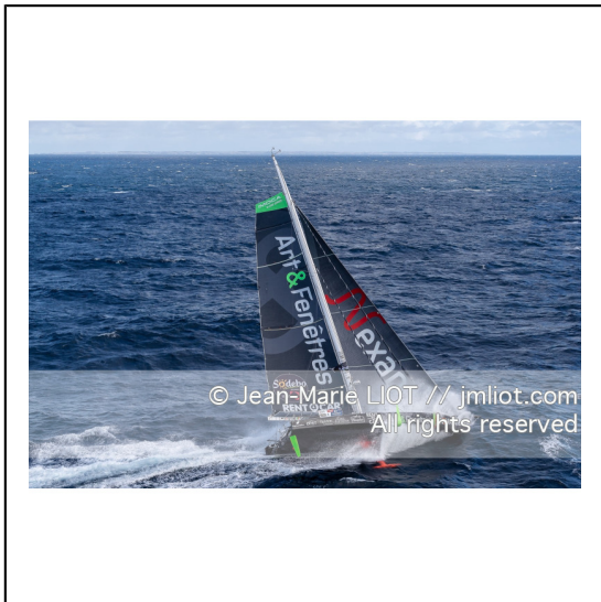
Fabrice Amédéo, skipper de l'IMOCA Newrest Art & Fenêtres à l'entrainement avant le départ du Vendée Globe 2020, mer d'Iroise le 29/08/2020, Photo © Jean-Marie LIOT.###.Fabrice Amédéo, skipper IMOCA Newrest Art & Fenêtres before the start of the Vendée Globe 2020, Iroise on august 28, 2020, Photo © Jean-Marie LIOT.