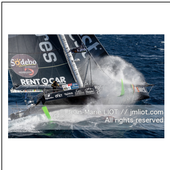
Fabrice Amédéo, skipper de l'IMOCA Newrest Art & Fenêtres à l'entrainement avant le départ du Vendée Globe 2020, mer d'Iroise le 29/08/2020, Photo © Jean-Marie LIOT.###.Fabrice Amédéo, skipper IMOCA Newrest Art & Fenêtres before the start of the Vendée Globe 2020, Iroise on august 28, 2020, Photo © Jean-Marie LIOT.