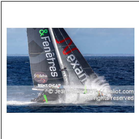
Fabrice Amédéo, skipper de l'IMOCA Newrest Art & Fenêtres à l'entrainement avant le départ du Vendée Globe 2020, mer d'Iroise le 29/08/2020, Photo © Jean-Marie LIOT.###.Fabrice Amédéo, skipper IMOCA Newrest Art & Fenêtres before the start of the Vendée Globe 2020, Iroise on august 28, 2020, Photo © Jean-Marie LIOT.