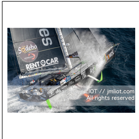
Fabrice Amédéo, skipper de l'IMOCA Newrest Art & Fenêtres à l'entraînement avant le départ du Vendée Globe 2020, mer d'Iroise le 29/08/2020, Photo © Jean-Marie LIOT.###.Fabrice Amédéo, skipper IMOCA Newrest Art & Fenêtres before the start of le Vendée Globe 2020, Iroise on august 28, 2020, Photo © Jean-Marie LIOT.