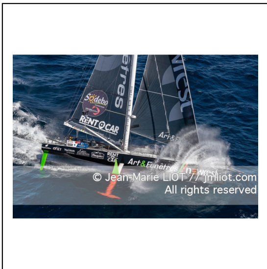
Fabrice Amédéo, skipper de l'IMOCA Newrest Art & Fenêtres à l'entraînement avant le départ du Vendée Globe 2020, mer d'Iroise le 29/08/2020, Photo © Jean-Marie LIOT.###.Fabrice Amédéo, skipper IMOCA Newrest Art & Fenêtres before the start of the Vendée Globe 2020, Iroise on august 28, 2020, Photo © Jean-Marie LIOT.