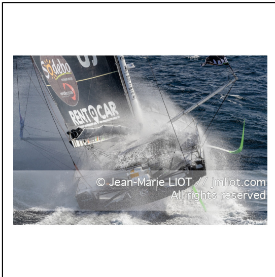
Fabrice Amédéo, skipper de l'IMOCA Newrest Art & Fenêtres à l'entraînement avant le départ du Vendée Globe 2020, mer d'Iroise le 29/08/2020, Photo © Jean-Marie LIOT.###.Fabrice Amédéo, skipper IMOCA Newrest Art & Fenêtres before the start of le Vendée Globe 2020, Iroise on august 28, 2020, Photo © Jean-Marie LIOT.