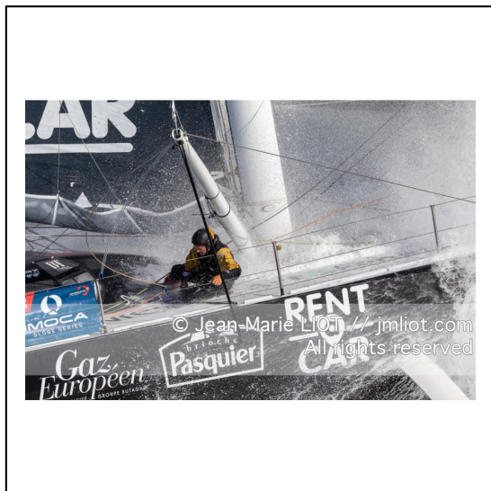
Fabrice Amédéo, skipper de l'IMOCA Newrest Art & Fenêtres à l'entrainement avant le départ du Vendée Globe 2020, mer d'Iroise le 29/08/2020, Photo © Jean-Marie LIOT.###.Fabrice Amédéo, skipper IMOCA Newrest Art & Fenêtres before the start of le Vendée Globe 2020, Iroise on august 28, 2020, Photo © Jean-Marie LIOT.