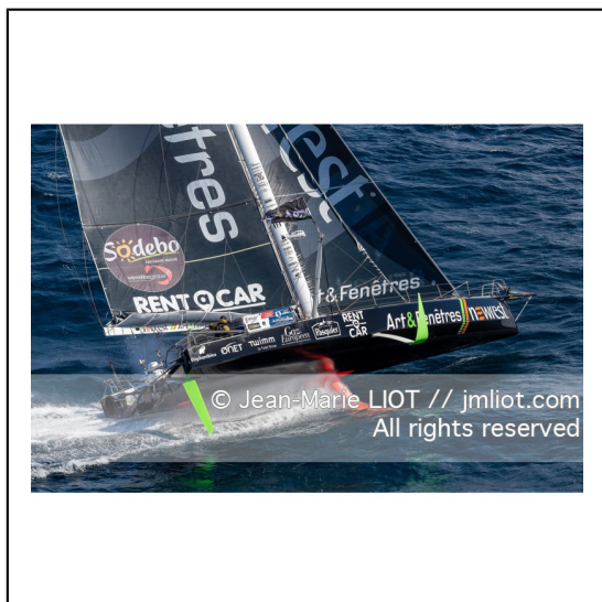
Fabrice Amédéo, skipper de l'IMOCA Newrest Art & Fenêtres à l'entrainement avant le départ du Vendée Globe 2020, mer d'Iroise le 29/08/2020, Photo © Jean-Marie LIOT.###.Fabrice Amédéo, skipper IMOCA Newrest Art & Fenêtres before the start of le Vendée Globe 2020, Iroise on august 28, 2020, Photo © Jean-Marie LIOT.