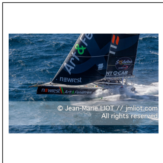
Fabrice Amédéo, skipper de l'IMOCA Newrest Art & Fenêtres à l'entraînement avant le départ du Vendée Globe 2020, mer d'Iroise le 29/08/2020, Photo © Jean-Marie LIOT.###.Fabrice Amédéo, skipper IMOCA Newrest Art & Fenêtres before the start of le Vendée Globe 2020, Iroise on august 28, 2020, Photo © Jean-Marie LIOT.