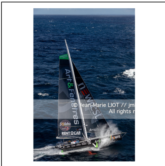
Fabrice Amédéo, skipper de l'IMOCA Newrest Art & Fenêtres à l'entraînement avant le départ du Vendée Globe 2020, mer d'Iroise le 29/08/2020, Photo © Jean-Marie LIOT.###.Fabrice Amédéo, skipper IMOCA Newrest Art & Fenêtres before the start of le Vendée Globe 2020, Iroise on august 28, 2020, Photo © Jean-Marie LIOT.