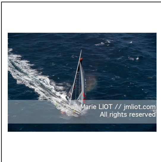
Fabrice Amédéo, skipper de l'IMOCA Newrest Art & Fenêtres à l'entraînement avant le départ du Vendée Globe 2020, mer d'Iroise le 29/08/2020, Photo © Jean-Marie LIOT.###.Fabrice Amédéo, skipper IMOCA Newrest Art & Fenêtres before the start of le Vendée Globe 2020, Iroise on august 28, 2020, Photo © Jean-Marie LIOT.