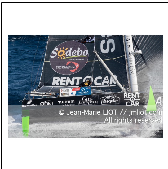
Fabrice Amédéo, skipper de l'IMOCA Newrest Art & Fenêtres à l'entraînement avant le départ du Vendée Globe 2020, mer d'Iroise le 29/08/2020, Photo © Jean-Marie LIOT.###.Fabrice Amédéo, skipper IMOCA Newrest Art & Fenêtres before the start of le Vendée Globe 2020, Iroise on august 28, 2020, Photo © Jean-Marie LIOT.