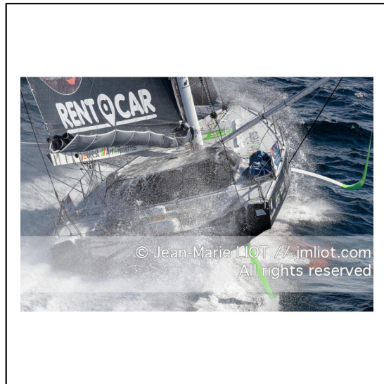
Fabrice Amédéo, skipper de l'IMOCA Newrest Art & Fenêtres à l'entraînement avant le départ du Vendée Globe 2020, mer d'Iroise le 29/08/2020, Photo © Jean-Marie LIOT.###.Fabrice Amédéo, skipper IMOCA Newrest Art & Fenêtres before the start of le Vendée Globe 2020, Iroise on august 28, 2020, Photo © Jean-Marie LIOT.