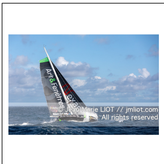
Fabrice Amédéo, skipper de l'IMOCA Newrest Art & Fenêtres à l'entrainement avant le départ du Vendée Globe 2020, mer d'Iroise le 29/08/2020, Photo © Jean-Marie LIOT.###.Fabrice Amédéo, skipper IMOCA Newrest Art & Fenêtres before the start of le Vendée Globe 2020, Iroise on august 28, 2020, Photo © Jean-Marie LIOT.