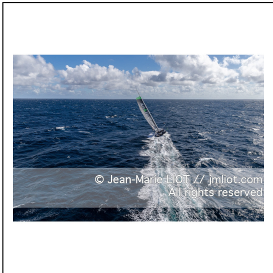
Fabrice Amédéo, skipper de l'IMOCA Newrest Art & Fenêtres à l'entraînement avant le départ du Vendée Globe 2020, mer d'Iroise le 29/08/2020, Photo © Jean-Marie LIOT.###.Fabrice Amédéo, skipper IMOCA Newrest Art & Fenêtres before the start of le Vendée Globe 2020, Iroise on august 28, 2020, Photo © Jean-Marie LIOT.