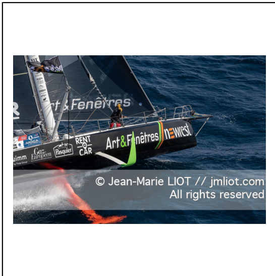
Fabrice Amédéo, skipper de l'IMOCA Newrest Art & Fenêtres à l'entrainement avant le départ du Vendée Globe 2020, mer d'Iroise le 29/08/2020, Photo © Jean-Marie LIOT.###.Fabrice Amédéo, skipper IMOCA Newrest Art & Fenêtres before the start of le Vendée Globe 2020, Iroise on august 28, 2020, Photo © Jean-Marie LIOT.