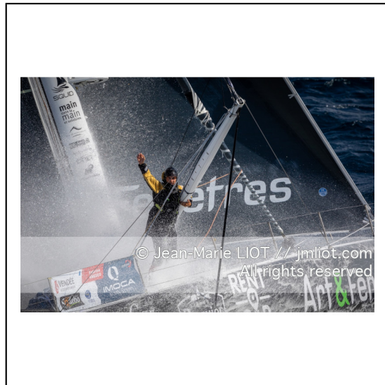
Fabrice Amédéo, skipper de l'IMOCA Newrest Art & Fenêtres à l'entrainement avant le départ du Vendée Globe 2020, mer d'Iroise le 29/08/2020, Photo © Jean-Marie LIOT.###.Fabrice Amédéo, skipper IMOCA Newrest Art & Fenêtres before the start of le Vendée Globe 2020, Iroise on august 28, 2020, Photo © Jean-Marie LIOT.