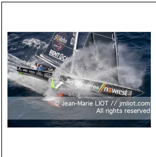
Fabrice Amédéo, skipper de l'IMOCA Newrest Art & Fenêtres à l'entraînement avant le départ du Vendée Globe 2020, mer d'Iroise le 29/08/2020, Photo © Jean-Marie LIOT.###.Fabrice Amédéo, skipper IMOCA Newrest Art & Fenêtres before the start of the Vendée Globe 2020, Iroise on august 28, 2020, Photo © Jean-Marie LIOT.