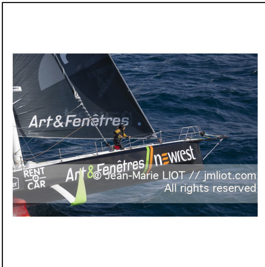
Fabrice Amédéo, skipper de l'IMOCA Newrest Art & Fenêtres à l'entrainement avant le départ du Vendée Globe 2020, mer d'Iroise le 29/08/2020, Photo © Jean-Marie LIOT.###.Fabrice Amédéo, skipper IMOCA Newrest Art & Fenêtres before the start of le Vendée Globe 2020, Iroise on august 28, 2020, Photo © Jean-Marie LIOT.