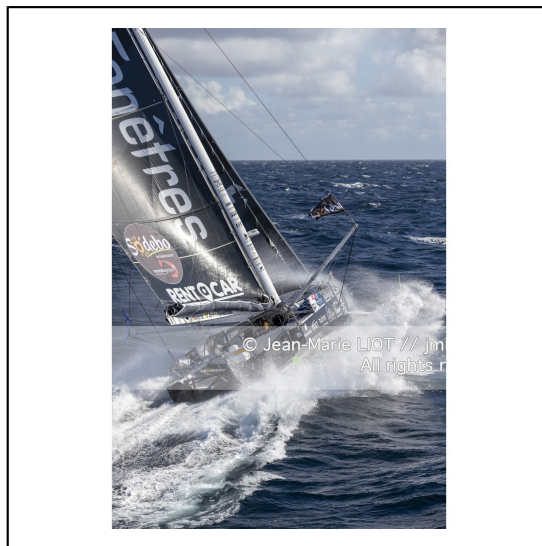
Fabrice Amédéo, skipper de l'IMOCA Newrest Art & Fenêtres à l'entrainement avant le départ du Vendée Globe 2020, mer d'Iroise le 29/08/2020, Photo © Jean-Marie LIOT.###.Fabrice Amédéo, skipper IMOCA Newrest Art & Fenêtres before the start of le Vendée Globe 2020, Iroise on august 28, 2020, Photo © Jean-Marie LIOT.