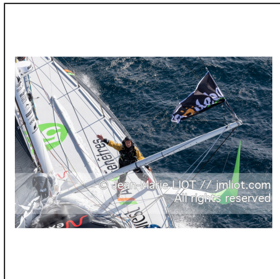
Fabrice Amédéo, skipper de l'IMOCA Newrest Art & Fenêtres à l'entrainement avant le départ du Vendée Globe 2020, mer d'Iroise le 29/08/2020, Photo © Jean-Marie LIOT.###.Fabrice Amédéo, skipper IMOCA Newrest Art & Fenêtres before the start of le Vendée Globe 2020, Iroise on august 28, 2020, Photo © Jean-Marie LIOT.