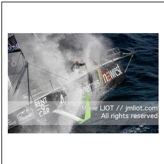
Fabrice Amédéo, skipper de l'IMOCA Newrest Art & Fenêtres à l'entrainement avant le départ du Vendée Globe 2020, mer d'Iroise le 29/08/2020, Photo © Jean-Marie LIOT.###.Fabrice Amédéo, skipper IMOCA Newrest Art & Fenêtres before the start of le Vendée Globe 2020, Iroise on august 28, 2020, Photo © Jean-Marie LIOT.