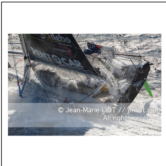
Fabrice Amédéo, skipper de l'IMOCA Newrest Art & Fenêtres à l'entrainement avant le départ du Vendée Globe 2020, mer d'Iroise le 29/08/2020, Photo © Jean-Marie LIOT.###.Fabrice Amédéo, skipper IMOCA Newrest Art & Fenêtres before the start of le Vendée Globe 2020, Iroise on august 28, 2020, Photo © Jean-Marie LIOT.