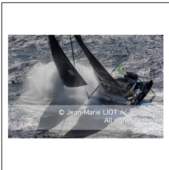
Fabrice Amédéo, skipper de l'IMOCA Newrest Art & Fenêtres à l'entraînement avant le départ du Vendée Globe 2020, mer d'Iroise le 29/08/2020, Photo © Jean-Marie LIOT.###.Fabrice Amédéo, skipper IMOCA Newrest Art & Fenêtres before the start of the Vendée Globe 2020, Iroise on august 28, 2020, Photo © Jean-Marie LIOT.