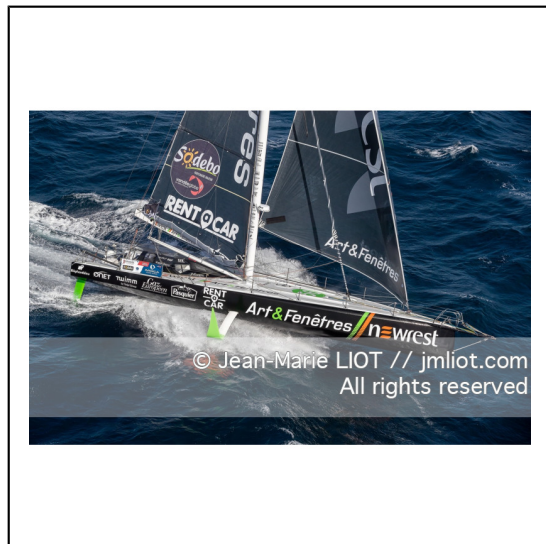
Fabrice Amédéo, skipper de l'IMOCA Newrest Art & Fenêtres à l'entraînement avant le départ du Vendée Globe 2020, mer d'Iroise le 29/08/2020, Photo © Jean-Marie LIOT.###.Fabrice Amédéo, skipper IMOCA Newrest Art & Fenêtres before the start of le Vendée Globe 2020, Iroise on august 28, 2020, Photo © Jean-Marie LIOT.