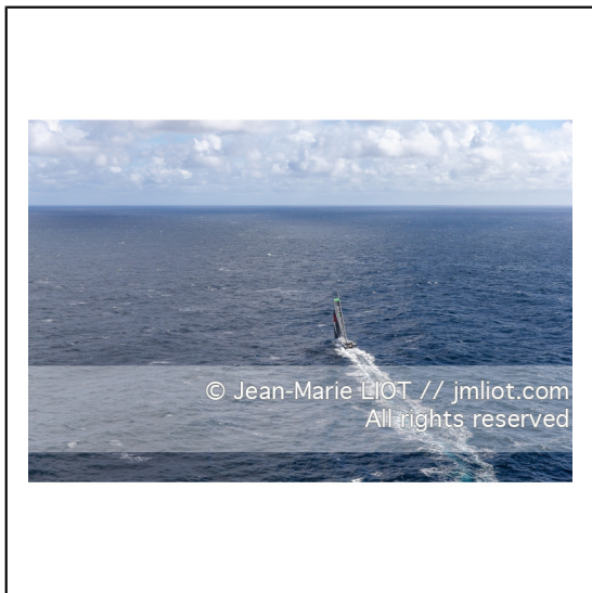
Fabrice Amédéo, skipper de l'IMOCA Newrest Art & Fenêtres à l'entraînement avant le départ du Vendée Globe 2020, mer d'Iroise le 29/08/2020, Photo © Jean-Marie LIOT.###.Fabrice Amédéo, skipper IMOCA Newrest Art & Fenêtres before the start of le Vendée Globe 2020, Iroise on august 28, 2020, Photo © Jean-Marie LIOT.