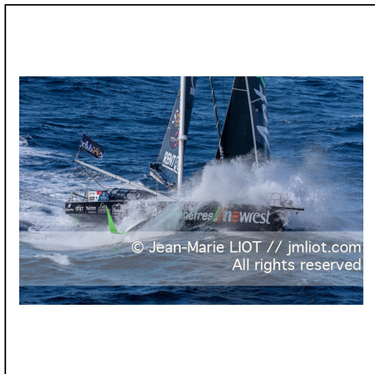
Fabrice Amédéo, skipper de l'IMOCA Newrest Art & Fenêtres à l'entrainement avant le départ du Vendée Globe 2020, mer d'Iroise le 29/08/2020, Photo © Jean-Marie LIOT.###.Fabrice Amédéo, skipper IMOCA Newrest Art & Fenêtres before the start of le Vendée Globe 2020, Iroise on august 28, 2020, Photo © Jean-Marie LIOT.