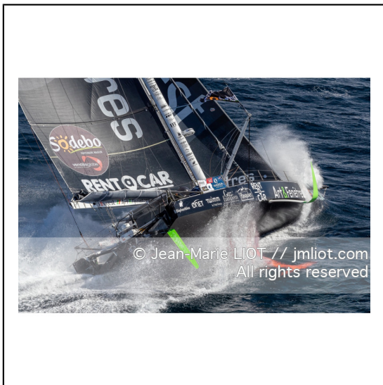
Fabrice Amédéo, skipper de l'IMOCA Newrest Art & Fenêtres à l'entrainement avant le départ du Vendée Globe 2020, mer d'Iroise le 29/08/2020, Photo © Jean-Marie LIOT.###.Fabrice Amédéo, skipper IMOCA Newrest Art & Fenêtres before the start of the Vendée Globe 2020, Iroise on august 28, 2020, Photo © Jean-Marie LIOT.