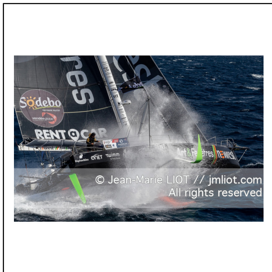
Fabrice Amédéo, skipper de l'IMOCA Newrest Art & Fenêtres à l'entrainement avant le départ du Vendée Globe 2020, mer d'Iroise le 29/08/2020, Photo © Jean-Marie LIOT.###.Fabrice Amédéo, skipper IMOCA Newrest Art & Fenêtres before the start of le Vendée Globe 2020, Iroise on august 28, 2020, Photo © Jean-Marie LIOT.