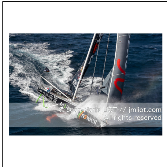
Fabrice Amédéo, skipper de l'IMOCA Newrest Art & Fenêtres à l'entraînement avant le départ du Vendée Globe 2020, mer d'Iroise le 29/08/2020, Photo © Jean-Marie LIOT.###.Fabrice Amédéo, skipper IMOCA Newrest Art & Fenêtres before the start of le Vendée Globe 2020, Iroise on august 28, 2020, Photo © Jean-Marie LIOT.