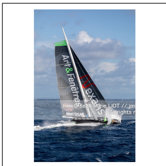
Fabrice Amédéo, skipper de l'IMOCA Newrest Art & Fenêtres à l'entrainement avant le départ du Vendée Globe 2020, mer d'Iroise le 29/08/2020, Photo © Jean-Marie LIOT.###.Fabrice Amédéo, skipper IMOCA Newrest Art & Fenêtres before the start of le Vendée Globe 2020, Iroise on august 28, 2020, Photo © Jean-Marie LIOT.