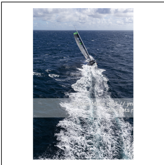
Fabrice Amédéo, skipper de l'IMOCA Newrest Art & Fenêtres à l'entraînement avant le départ du Vendée Globe 2020, mer d'Iroise le 29/08/2020, Photo © Jean-Marie LIOT.###.Fabrice Amédéo, skipper IMOCA Newrest Art & Fenêtres before the start of le Vendée Globe 2020, Iroise on august 28, 2020, Photo © Jean-Marie LIOT.