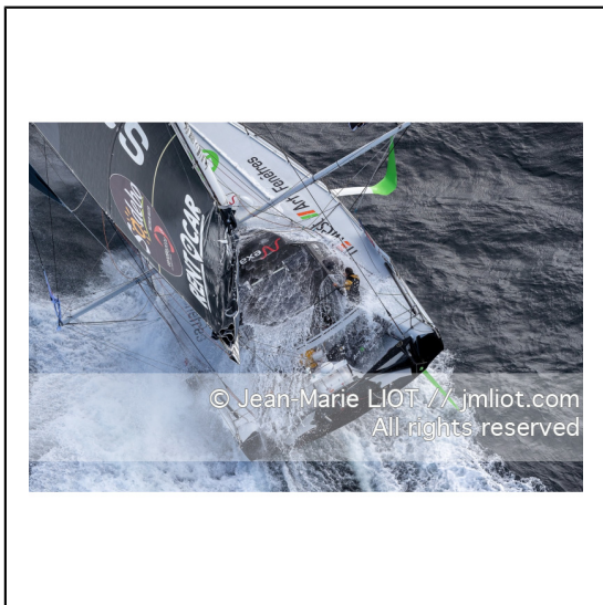
Fabrice Amédéo, skipper de l'IMOCA Newrest Art & Fenêtres à l'entrainement avant le départ du Vendée Globe 2020, mer d'Iroise le 29/08/2020, Photo © Jean-Marie LIOT.###.Fabrice Amédéo, skipper IMOCA Newrest Art & Fenêtres before the start of the Vendée Globe 2020, Iroise on august 28, 2020, Photo © Jean-Marie LIOT.