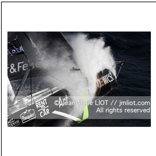
Fabrice Amédéo, skipper de l'IMOCA Newrest Art & Fenêtres à l'entrainement avant le départ du Vendée Globe 2020, mer d'Iroise le 29/08/2020, Photo © Jean-Marie LIOT.###.Fabrice Amédéo, skipper IMOCA Newrest Art & Fenêtres before the start of le Vendée Globe 2020, Iroise on august 28, 2020, Photo © Jean-Marie LIOT.