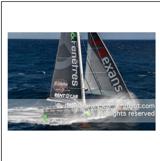
Fabrice Amédéo, skipper de l'IMOCA Newrest Art & Fenêtres à l'entraînement avant le départ du Vendée Globe 2020, mer d'Iroise le 29/08/2020, Photo © Jean-Marie LIOT.###.Fabrice Amédéo, skipper IMOCA Newrest Art & Fenêtres before the start of le Vendée Globe 2020, Iroise on august 28, 2020, Photo © Jean-Marie LIOT.