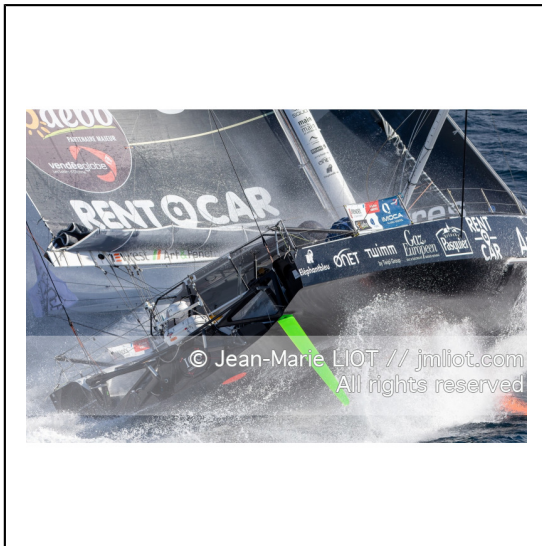
Fabrice Amédéo, skipper de l'IMOCA Newrest Art & Fenêtres à l'entrainement avant le départ du Vendée Globe 2020, mer d'Iroise le 29/08/2020, Photo © Jean-Marie LIOT.###.Fabrice Amédéo, skipper IMOCA Newrest Art & Fenêtres before the start of le Vendée Globe 2020, Iroise on august 28, 2020, Photo © Jean-Marie LIOT.