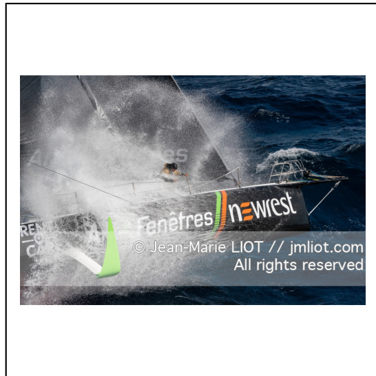
Fabrice Amédéo, skipper de l'IMOCA Newrest Art & Fenêtres à l'entrainement avant le départ du Vendée Globe 2020, mer d'Iroise le 29/08/2020, Photo © Jean-Marie LIOT.###.Fabrice Amédéo, skipper IMOCA Newrest Art & Fenêtres before the start of le Vendée Globe 2020, Iroise on august 28, 2020, Photo © Jean-Marie LIOT.