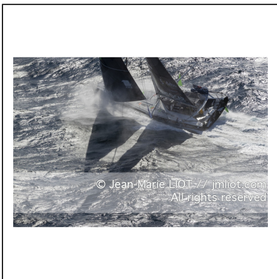
Fabrice Amédéo, skipper de l'IMOCA Newrest Art & Fenêtres à l'entraînement avant le départ du Vendée Globe 2020, mer d'Iroise le 29/08/2020, Photo © Jean-Marie LIOT.###.Fabrice Amédéo, skipper IMOCA Newrest Art & Fenêtres before the start of the Vendée Globe 2020, Iroise on august 28, 2020, Photo © Jean-Marie LIOT.