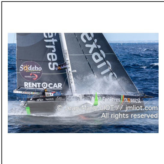
Fabrice Amédéo, skipper de l'IMOCA Newrest Art & Fenêtres à l'entrainement avant le départ du Vendée Globe 2020, mer d'Iroise le 29/08/2020, Photo © Jean-Marie LIOT.###.Fabrice Amédéo, skipper IMOCA Newrest Art & Fenêtres before the start of the Vendée Globe 2020, Iroise on august 28, 2020, Photo © Jean-Marie LIOT.