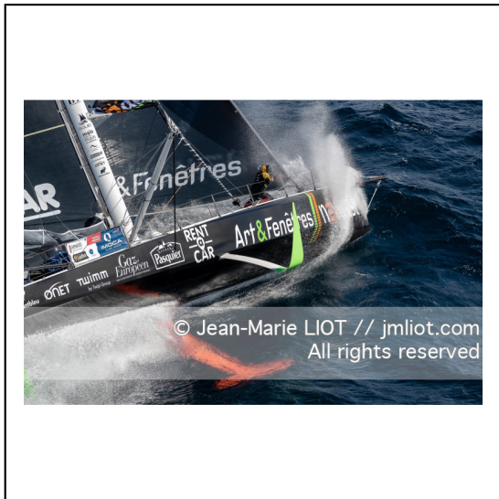
Fabrice Amédéo, skipper de l'IMOCA Newrest Art & Fenêtres à l'entrainement avant le départ du Vendée Globe 2020, mer d'Iroise le 29/08/2020, Photo © Jean-Marie LIOT.###.Fabrice Amédéo, skipper IMOCA Newrest Art & Fenêtres before the start of le Vendée Globe 2020, Iroise on august 28, 2020, Photo © Jean-Marie LIOT.