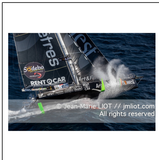
Fabrice Amédéo, skipper de l'IMOCA Newrest Art & Fenêtres à l'entrainement avant le départ du Vendée Globe 2020, mer d'Iroise le 29/08/2020, Photo © Jean-Marie LIOT.###.Fabrice Amédéo, skipper IMOCA Newrest Art & Fenêtres before the start of le Vendée Globe 2020, Iroise on august 28, 2020, Photo © Jean-Marie LIOT.