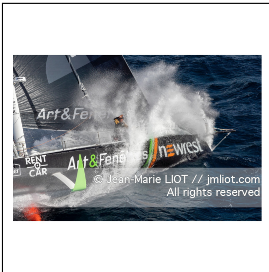
Fabrice Amédéo, skipper de l'IMOCA Newrest Art & Fenêtres à l'entrainement avant le départ du Vendée Globe 2020, mer d'Iroise le 29/08/2020, Photo © Jean-Marie LIOT.###.Fabrice Amédéo, skipper IMOCA Newrest Art & Fenêtres before the start of le Vendée Globe 2020, Iroise on august 28, 2020, Photo © Jean-Marie LIOT.