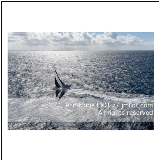
Fabrice Amédéo, skipper de l'IMOCA Newrest Art & Fenêtres à l'entraînement avant le départ du Vendée Globe 2020, mer d'Iroise le 29/08/2020, Photo © Jean-Marie LIOT.###.Fabrice Amédéo, skipper IMOCA Newrest Art & Fenêtres before the start of le Vendée Globe 2020, Iroise on august 28, 2020, Photo © Jean-Marie LIOT.