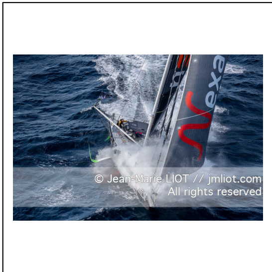
Fabrice Amédéo, skipper de l'IMOCA Newrest Art & Fenêtres à l'entrainement avant le départ du Vendée Globe 2020, mer d'Iroise le 29/08/2020, Photo © Jean-Marie LIOT.###.Fabrice Amédéo, skipper IMOCA Newrest Art & Fenêtres before the start of the Vendée Globe 2020, Iroise on august 28, 2020, Photo © Jean-Marie LIOT.