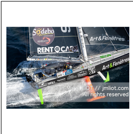
Fabrice Amédéo, skipper de l'IMOCA Newrest Art & Fenêtres à l'entraînement avant le départ du Vendée Globe 2020, mer d'Iroise le 29/08/2020, Photo © Jean-Marie LIOT.###.Fabrice Amédéo, skipper IMOCA Newrest Art & Fenêtres before the start of le Vendée Globe 2020, Iroise on august 28, 2020, Photo © Jean-Marie LIOT.