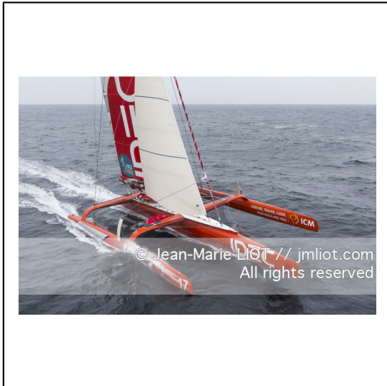
Le 8 octobre 2014. Francis Joyon à la barre du Maxi Trimaran IDEC à l'entraînement avant le départ de la Route du Rhum Destination Guadeloupe 2014..Photo © Jean-Marie LIOT / DPPI.###.Le 8 octobre 2014. Francis Joyon at the helm of Maxi Trimaran IDEC training before the start of la Route du Rhum Destination Guadeloupe 2014..Photo © Jean-Marie LIOT / DPPI.