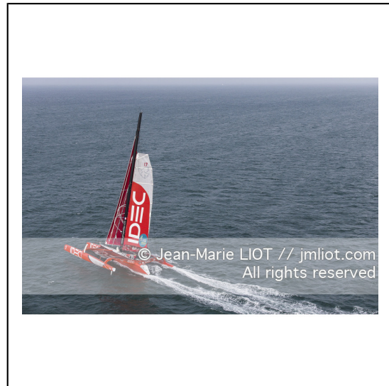
Le 8 octobre 2014. Francis Joyon à la barre du Maxi Trimaran IDEC à l'entraînement avant le départ de la Route du Rhum Destination Guadeloupe 2014..Photo © Jean-Marie LIOT / DPPI.###.Le 8 octobre 2014. Francis Joyon at the helm of Maxi Trimaran IDEC training before the start of la Route du Rhum Destination Guadeloupe 2014..Photo © Jean-Marie LIOT / DPPI.