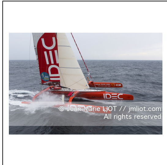
Le 8 octobre 2014. Francis Joyon à la barre du Maxi Trimaran IDEC à l'entraînement avant le départ de la Route du Rhum Destination Guadeloupe 2014..Photo © Jean-Marie LIOT / DPPI.###.Le 8 octobre 2014. Francis Joyon at the helm of Maxi Trimaran IDEC training before the start of la Route du Rhum Destination Guadeloupe 2014..Photo © Jean-Marie LIOT / DPPI.