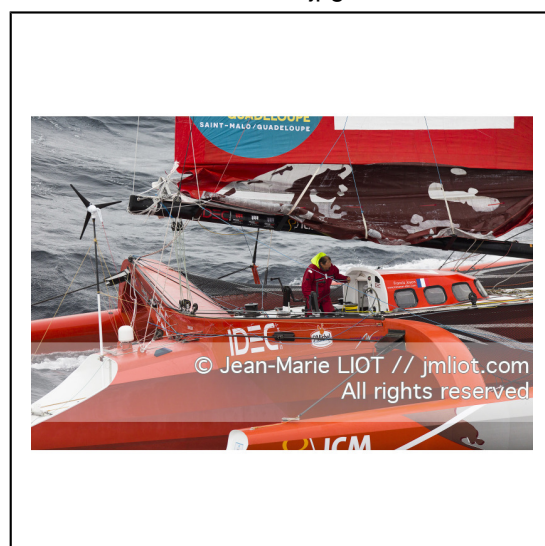
Le 8 octobre 2014. Francis Joyon à la barre du Maxi Trimaran IDEC à l'entrainement avant le départ de la Route du Rhum Destination Guadeloupe 2014..Photo © Jean-Marie LIOT / DPPI.###.Le 8 octobre 2014. Francis Joyon at the helm of Maxi Trimaran IDEC training before the start of la Route du Rhum Destination Guadeloupe 2014..Photo © Jean-Marie LIOT / DPPI.