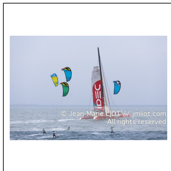
Le 8 octobre 2014. Francis Joyon à la barre du Maxi Trimaran IDEC à l'entrainement avant le départ de la Route du Rhum Destination Guadeloupe 2014..Photo © Jean-Marie LIOT / DPPI.###.Le 8 octobre 2014. Francis Joyon at the helm of Maxi Trimaran IDEC training before the start of la Route du Rhum Destination Guadeloupe 2014..Photo © Jean-Marie LIOT / DPPI.