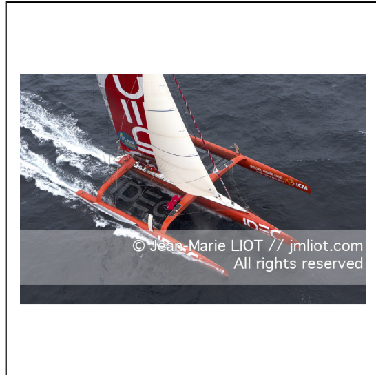
Le 8 octobre 2014. Francis Joyon à la barre du Maxi Trimaran IDEC à l'entraînement avant le départ de la Route du Rhum Destination Guadeloupe 2014..Photo © Jean-Marie LIOT / DPPI.###.Le 8 octobre 2014. Francis Joyon at the helm of Maxi Trimaran IDEC training before the start of la Route du Rhum Destination Guadeloupe 2014..Photo © Jean-Marie LIOT / DPPI.