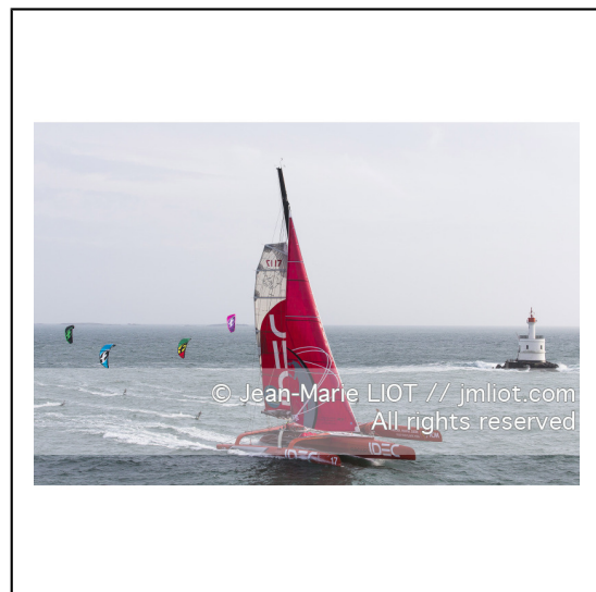
Le 8 octobre 2014. Francis Joyon à la barre du Maxi Trimaran IDEC à l'entraînement avant le départ de la Route du Rhum Destination Guadeloupe 2014..Photo © Jean-Marie LIOT / DPPI.###.Le 8 octobre 2014. Francis Joyon at the helm of Maxi Trimaran IDEC training before the start of la Route du Rhum Destination Guadeloupe 2014..Photo © Jean-Marie LIOT / DPPI.