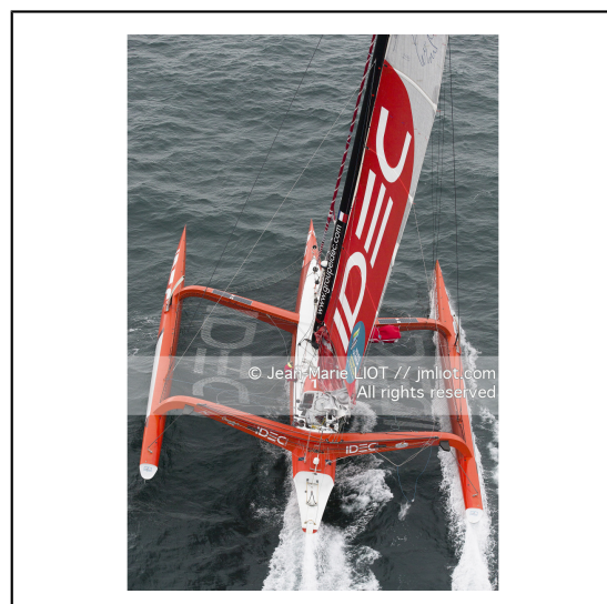
Le 8 octobre 2014. Francis Joyon à la barre du Maxi Trimaran IDEC à l'entraînement avant le départ de la Route du Rhum Destination Guadeloupe 2014..Photo © Jean-Marie LIOT / DPPI.###.Le 8 octobre 2014. Francis Joyon at the helm of Maxi Trimaran IDEC training before the start of la Route du Rhum Destination Guadeloupe 2014..Photo © Jean-Marie LIOT / DPPI.