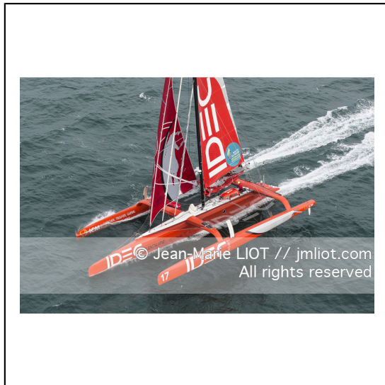
Le 8 octobre 2014. Francis Joyon à la barre du Maxi Trimaran IDEC à l'entraînement avant le départ de la Route du Rhum Destination Guadeloupe 2014..Photo © Jean-Marie LIOT / DPPI.###.Le 8 octobre 2014. Francis Joyon at the helm of Maxi Trimaran IDEC training before the start of la Route du Rhum Destination Guadeloupe 2014..Photo © Jean-Marie LIOT / DPPI.