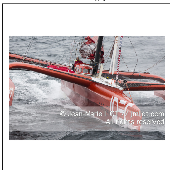
Le 8 octobre 2014. Francis Joyon à la barre du Maxi Trimaran IDEC à l'entrainement avant le départ de la Route du Rhum Destination Guadeloupe 2014..Photo © Jean-Marie LIOT / DPPI.###.Le 8 octobre 2014. Francis Joyon at the helm of Maxi Trimaran IDEC training before the start of la Route du Rhum Destination Guadeloupe 2014..Photo © Jean-Marie LIOT / DPPI.