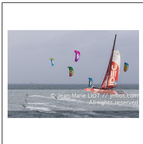
Le 8 octobre 2014. Francis Joyon à la barre du Maxi Trimaran IDEC à l'entrainement avant le départ de la Route du Rhum Destination Guadeloupe 2014..Photo © Jean-Marie LIOT / DPPI.###.Le 8 octobre 2014. Francis Joyon at the helm of Maxi Trimaran IDEC training before the start of la Route du Rhum Destination Guadeloupe 2014..Photo © Jean-Marie LIOT / DPPI.