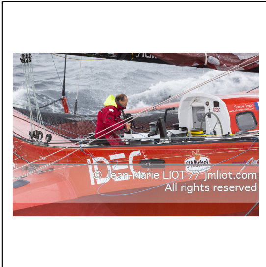
Le 8 octobre 2014. Francis Joyon à la barre du Maxi Trimaran IDEC à l'entraînement avant le départ de la Route du Rhum Destination Guadeloupe 2014..Photo © Jean-Marie LIOT / DPPI.###.Le 8 octobre 2014. Francis Joyon at the helm of Maxi Trimaran IDEC training before the start of la Route du Rhum Destination Guadeloupe 2014..Photo © Jean-Marie LIOT / DPPI.