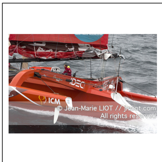
Le 8 octobre 2014. Francis Joyon à la barre du Maxi Trimaran IDEC à l'entraînement avant le départ de la Route du Rhum Destination Guadeloupe 2014..Photo © Jean-Marie LIOT / DPPI.###.Le 8 octobre 2014. Francis Joyon at the helm of Maxi Trimaran IDEC training before the start of la Route du Rhum Destination Guadeloupe 2014..Photo © Jean-Marie LIOT / DPPI.