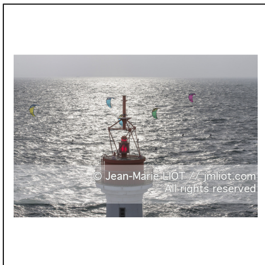
Le 8 octobre 2014. Francis Joyon à la barre du Maxi Trimaran IDEC à l'entraînement avant le départ de la Route du Rhum Destination Guadeloupe 2014..Photo © Jean-Marie LIOT / DPPI.###.Le 8 octobre 2014. Francis Joyon at the helm of Maxi Trimaran IDEC training before the start of la Route du Rhum Destination Guadeloupe 2014..Photo © Jean-Marie LIOT / DPPI.