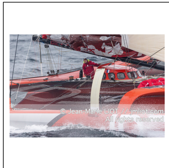
Le 8 octobre 2014. Francis Joyon à la barre du Maxi Trimaran IDEC à l'entraînement avant le départ de la Route du Rhum Destination Guadeloupe 2014..Photo © Jean-Marie LIOT / DPPI.###.Le 8 octobre 2014. Francis Joyon at the helm of Maxi Trimaran IDEC training before the start of la Route du Rhum Destination Guadeloupe 2014..Photo © Jean-Marie LIOT / DPPI.