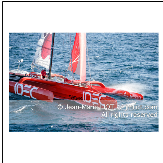
Le 10 octobre 2007, au large de belle Ile, Francis Joyon à l'entrainement à bord du maxi trimaran IDEC avant la tentative de record du tour du monde en solitaire. Photo © Jean-Marie Liot / DPPI.###.October 10, 2007, off the beautiful island, Francis Joyon training aboard the maxi trimaran IDEC before the attempt to record the world tour alone. Photo © Jean-Marie Liot / DPPI