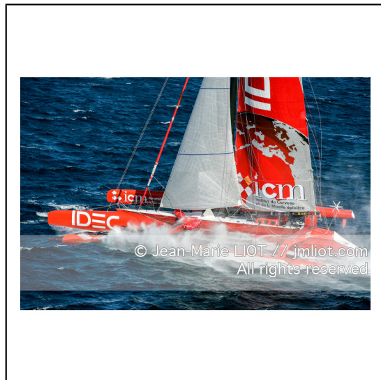
Le 10 octobre 2007, au large de belle Ile, Francis Joyon à l'entrainement à bord du maxi trimaran IDEC avant la tentative de record du tour du monde en solitaire. Photo © Jean-Marie Liot / DPPI.###.October 10, 2007, off the beautiful island, Francis Joyon training aboard the maxi trimaran IDEC before the attempt to record the world tour alone. Photo © Jean-Marie Liot / DPPI