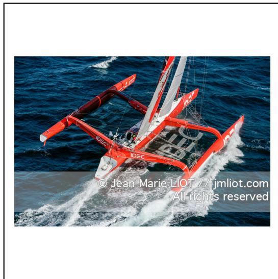
Le 10 octobre 2007, au large de belle Ile, Francis Joyon à l'entrainement à bord du maxi trimaran IDEC avant la tentative de record du tour du monde en solitaire. Photo © Jean-Marie Liot / DPPI.###.October 10, 2007, off the beautiful island, Francis Joyon training aboard the maxi trimaran IDEC before the attempt to record the world tour alone. Photo © Jean-Marie Liot / DPPI