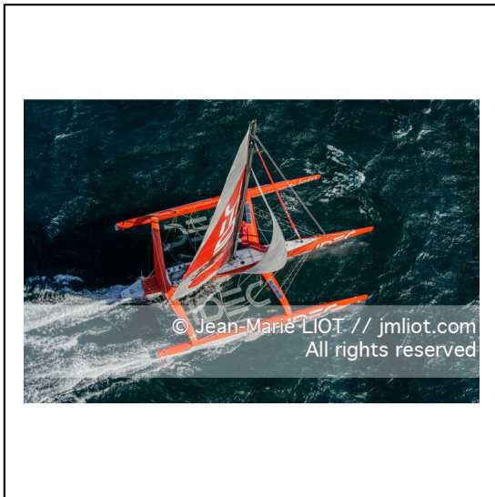
Le 10 octobre 2007, au large de belle Ile, Francis Joyon à l'entrainement à bord du maxi trimaran IDEC avant la tentative de record du tour du monde en solitaire. Photo © Jean-Marie Liot / DPPI.###.October 10, 2007, off the beautiful island, Francis Joyon training aboard the maxi trimaran IDEC before the attempt to record the world tour alone. Photo © Jean-Marie Liot / DPPI