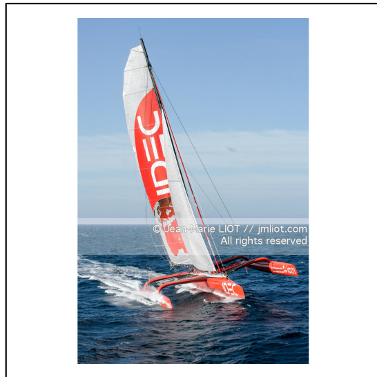
Le 10 octobre 2007, au large de belle Ile, Francis Joyon à l'entrainement à bord du maxi trimaran IDEC avant la tentative de record du tour du monde en solitaire. Photo © Jean-Marie Liot / DPPI.###.October 10, 2007, off the beautiful island, Francis Joyon training aboard the maxi trimaran IDEC before the attempt to record the world tour alone. Photo © Jean-Marie Liot / DPPI