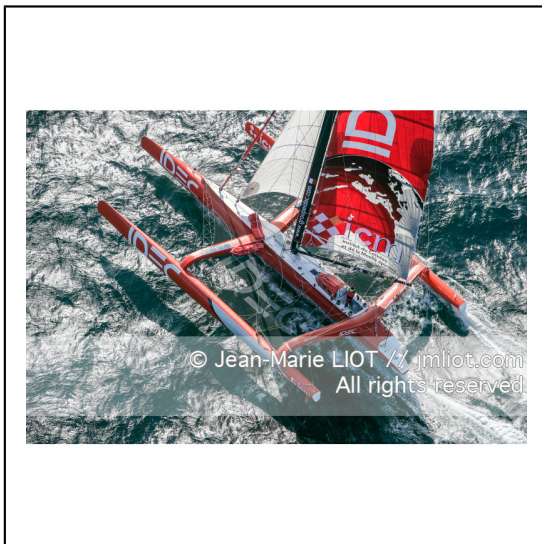
Le 10 octobre 2007, au large de belle Ile, Francis Joyon à l'entrainement à bord du maxi trimaran IDEC avant la tentative de record du tour du monde en solitaire. Photo © Jean-Marie Liot / DPPI.###.October 10, 2007, off the beautiful island, Francis Joyon training aboard the maxi trimaran IDEC before the attempt to record the world tour alone. Photo © Jean-Marie Liot / DPPI