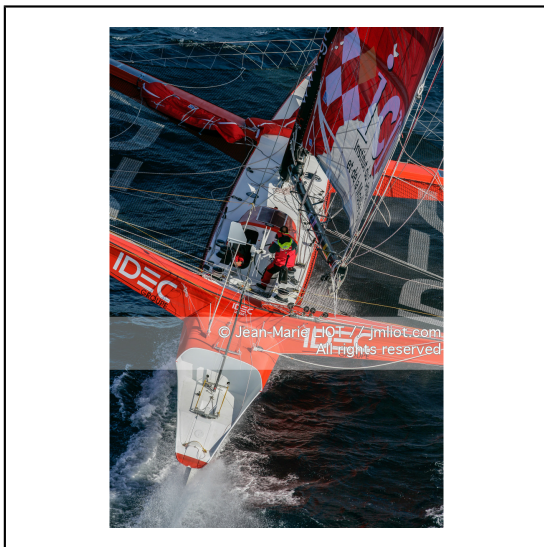
Le 10 octobre 2007, au large de belle Ile, Francis Joyon à l'entrainement à bord du maxi trimaran IDEC avant la tentative de record du tour du monde en solitaire. Photo © Jean-Marie Liot / DPPI.###.October 10, 2007, off the beautiful island, Francis Joyon training aboard the maxi trimaran IDEC before the attempt to record the world tour alone. Photo © Jean-Marie Liot / DPPI