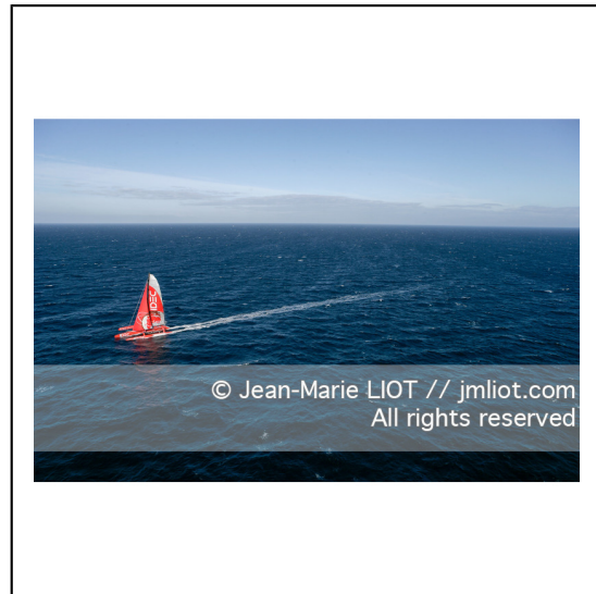
Le 10 octobre 2007, au large de belle Ile, Francis Joyon à l'entrainement à bord du maxi trimaran IDEC avant la tentative de record du tour du monde en solitaire. Photo © Jean-Marie Liot / DPPI.###.October 10, 2007, off the beautiful island, Francis Joyon training aboard the maxi trimaran IDEC before the attempt to record the world tour alone. Photo © Jean-Marie Liot / DPPI