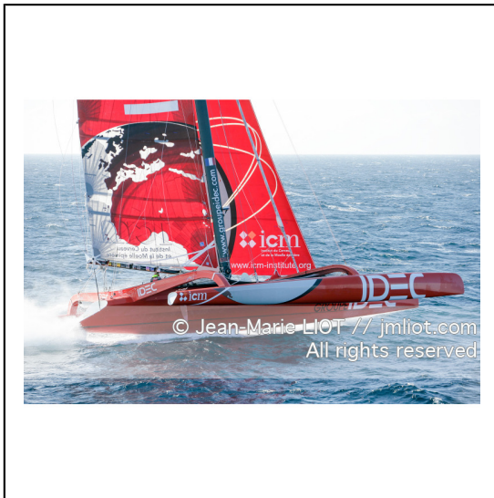
Le 10 octobre 2007, au large de belle Ile, Francis Joyon à l'entrainement à bord du maxi trimaran IDEC avant la tentative de record du tour du monde en solitaire. Photo © Jean-Marie Liot / DPPI.###.October 10, 2007, off the beautiful island, Francis Joyon training aboard the maxi trimaran IDEC before the attempt to record the world tour alone. Photo © Jean-Marie Liot / DPPI