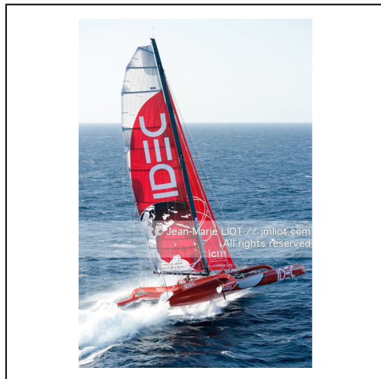
Le 10 octobre 2007, au large de belle Ile, Francis Joyon à l'entrainement à bord du maxi trimaran IDEC avant la tentative de record du tour du monde en solitaire. Photo © Jean-Marie Liot / DPPI.###.October 10, 2007, off the beautiful island, Francis Joyon training aboard the maxi trimaran IDEC before the attempt to record the world tour alone. Photo © Jean-Marie Liot / DPPI