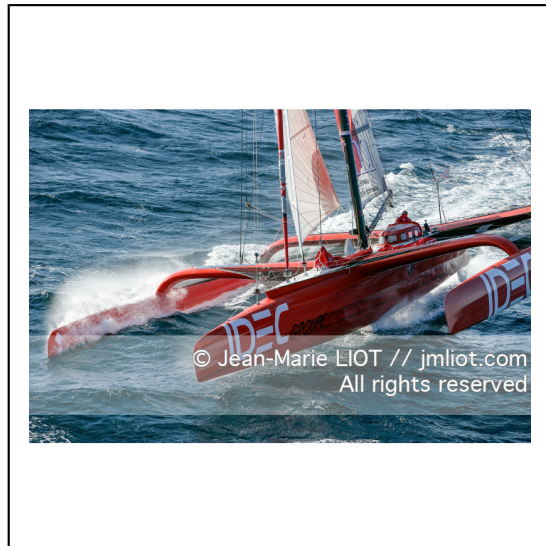
Le 10 octobre 2007, au large de belle Ile, Francis Joyon à l'entrainement à bord du maxi trimaran IDEC avant la tentative de record du tour du monde en solitaire. Photo © Jean-Marie Liot / DPPI.###.October 10, 2007, off the beautiful island, Francis Joyon training aboard the maxi trimaran IDEC before the attempt to record the world tour alone. Photo © Jean-Marie Liot / DPPI