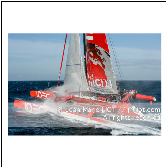
Le 10 octobre 2007, au large de belle Ile, Francis Joyon à l'entrainement à bord du maxi trimaran IDEC avant la tentative de record du tour du monde en solitaire. Photo © Jean-Marie Liot / DPPI.###.October 10, 2007, off the beautiful island, Francis Joyon training aboard the maxi trimaran IDEC before the attempt to record the world tour alone. Photo © Jean-Marie Liot / DPPI