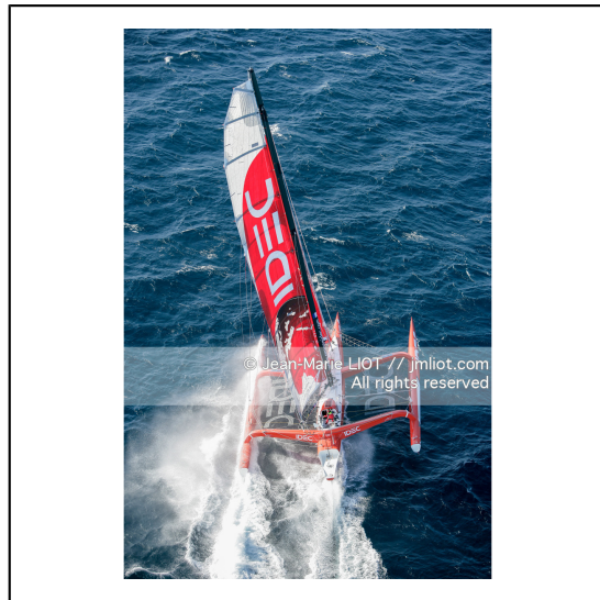
Le 10 octobre 2007, au large de belle Ile, Francis Joyon à l'entrainement à bord du maxi trimaran IDEC avant la tentative de record du tour du monde en solitaire. Photo © Jean-Marie Liot / DPPI.###.October 10, 2007, off the beautiful island, Francis Joyon training aboard the maxi trimaran IDEC before the attempt to record the world tour alone. Photo © Jean-Marie Liot / DPPI