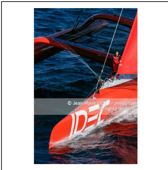
Le 10 octobre 2007, au large de belle Ile, Francis Joyon à l'entrainement à bord du maxi trimaran IDEC avant la tentative de record du tour du monde en solitaire. Photo © Jean-Marie Liot / DPPI.###.October 10, 2007, off the beautiful island, Francis Joyon training aboard the maxi trimaran IDEC before the attempt to record the world tour alone. Photo © Jean-Marie Liot / DPPI