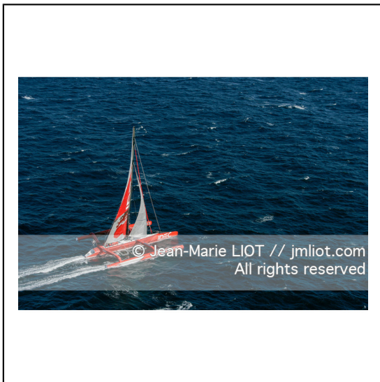
Le 10 octobre 2007, au large de belle Ile, Francis Joyon à l'entrainement à bord du maxi trimaran IDEC avant la tentative de record du tour du monde en solitaire. Photo © Jean-Marie Liot / DPPI.###.October 10, 2007, off the beautiful island, Francis Joyon training aboard the maxi trimaran IDEC before the attempt to record the world tour alone. Photo © Jean-Marie Liot / DPPI