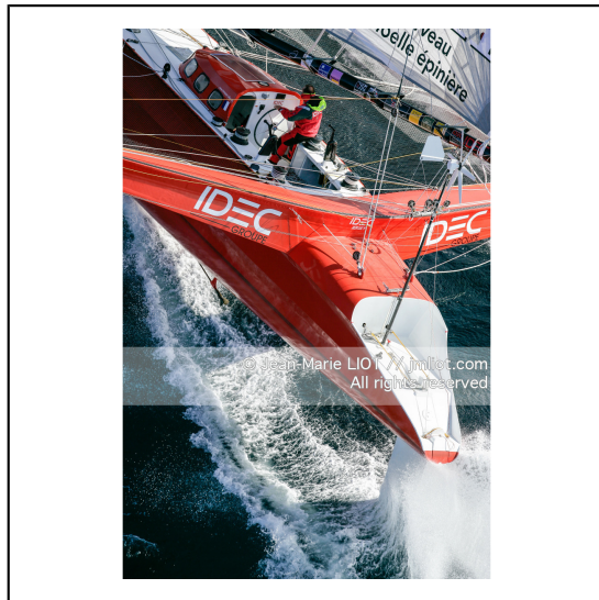
Le 10 octobre 2007, au large de belle Ile, Francis Joyon à l'entrainement à bord du maxi trimaran IDEC avant la tentative de record du tour du monde en solitaire. Photo © Jean-Marie Liot / DPPI.###.October 10, 2007, off the beautiful island, Francis Joyon training aboard the maxi trimaran IDEC before the attempt to record the world tour alone. Photo © Jean-Marie Liot / DPPI