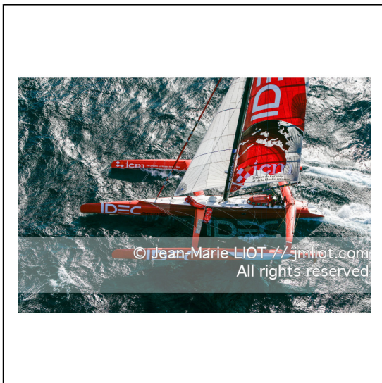
Le 10 octobre 2007, au large de belle Ile, Francis Joyon à l'entrainement à bord du maxi trimaran IDEC avant la tentative de record du tour du monde en solitaire. Photo © Jean-Marie Liot / DPPI.###.October 10, 2007, off the beautiful island, Francis Joyon training aboard the maxi trimaran IDEC before the attempt to record the world tour alone. Photo © Jean-Marie Liot / DPPI