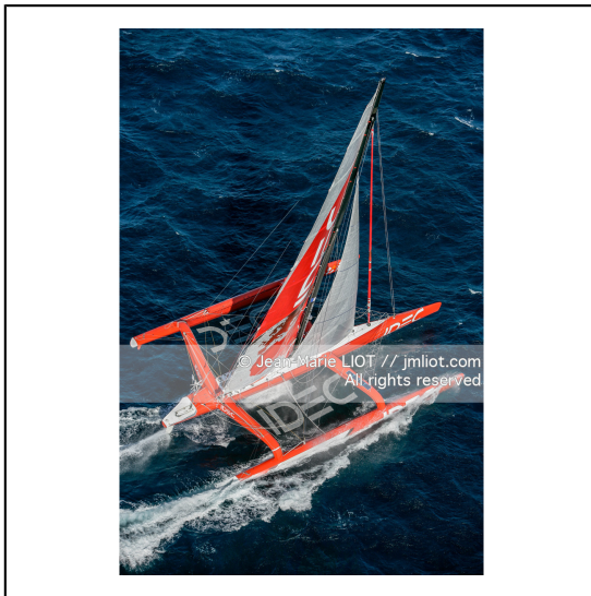
Le 10 octobre 2007, au large de belle Ile, Francis Joyon à l'entrainement à bord du maxi trimaran IDEC avant la tentative de record du tour du monde en solitaire. Photo © Jean-Marie Liot / DPPI.###.October 10, 2007, off the beautiful island, Francis Joyon training aboard the maxi trimaran IDEC before the attempt to record the world tour alone. Photo © Jean-Marie Liot / DPPI