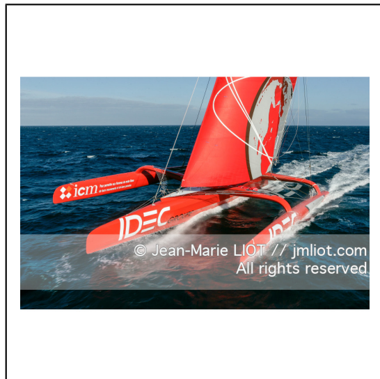
Le 10 octobre 2007, au large de belle Ile, Francis Joyon à l'entrainement à bord du maxi trimaran IDEC avant la tentative de record du tour du monde en solitaire. Photo © Jean-Marie Liot / DPPI.###.October 10, 2007, off the beautiful island, Francis Joyon training aboard the maxi trimaran IDEC before the attempt to record the world tour alone. Photo © Jean-Marie Liot / DPPI