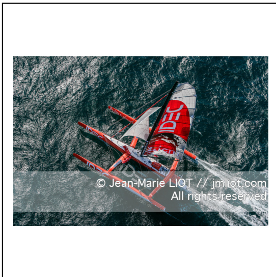
Le 10 octobre 2007, au large de belle Ile, Francis Joyon à l'entrainement à bord du maxi trimaran IDEC avant la tentative de record du tour du monde en solitaire. Photo © Jean-Marie Liot / DPPI.###.October 10, 2007, off the beautiful island, Francis Joyon training aboard the maxi trimaran IDEC before the attempt to record the world tour alone. Photo © Jean-Marie Liot / DPPI