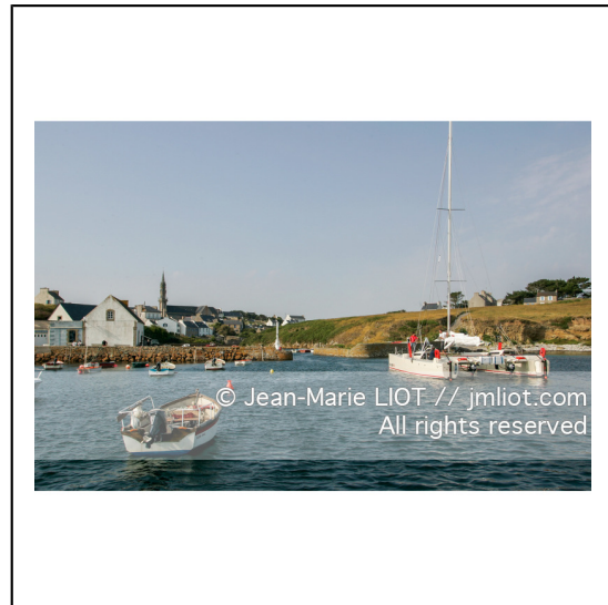
Ouessant est une commune insulaire du département du finistere. Le bourg d'Ouessant s'appelle Lampaul.###.Ouessant is an island commune of the Department of Finistere. The village of Ouessant is called Lampaul.