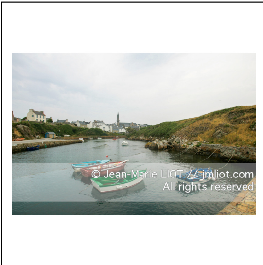
Ouessant est une commune insulaire du département du finistere. Le bourg d'Ouessant s'appelle Lampaul.###.Ouessant is an island commune of the Department of Finistere. The village of Ouessant is called Lampaul.