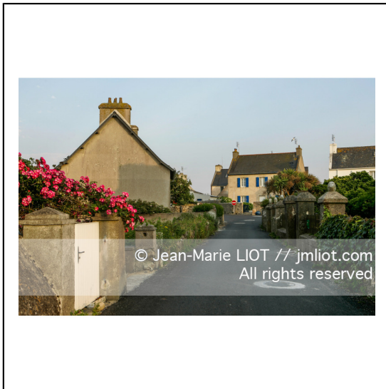
Ouessant est une commune insulaire du département du finistere. Le bourg d'Ouessant s'appelle Lampaul. ###.Ouessant is an island commune of the Department of Finistere. The village of Ouessant is called Lampaul.