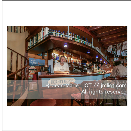
Ouessant est une commune insulaire du département du finistere. Le bourg d'Ouessant s'appelle Lampaul.###.Ouessant is an island commune of the Department of Finistere. The village of Ouessant is called Lampaul.