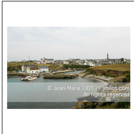
Ouessant est une commune insulaire du département du finistere. Le bourg d'Ouessant s'appelle Lampaul.###.Ouessant is an island commune of the Department of Finistere. The village of Ouessant is called Lampaul.