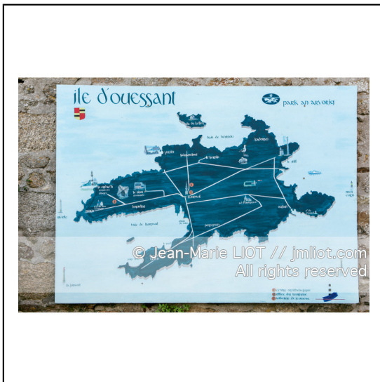
Ouessant est une commune insulaire du département du finistere. Le bourg d'Ouessant s'appelle Lampaul. Photo© Jean-Marie Liot.###.Ouessant is an island commune of the Department of Finistere. The village of Ouessant is called Lampaul. Photo © Jean-Marie Liot