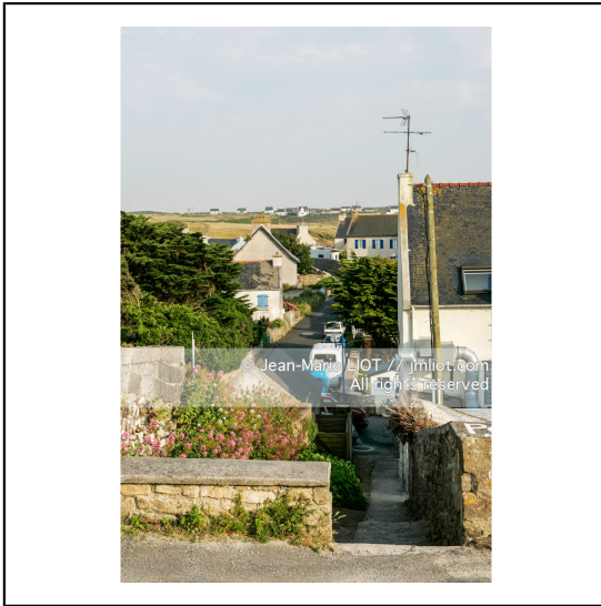
Ouessant est une commune insulaire du département du finistere. Le bourg d'Ouessant s'appelle Lampaul.###.Ouessant is an island commune of the Department of Finistere. The village of Ouessant is called Lampaul.